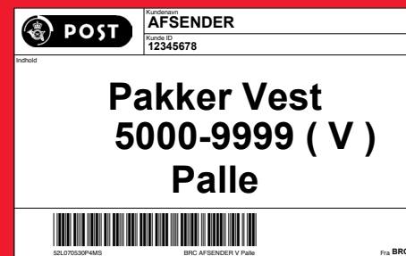
Denne mærkeseddel sættes på palle