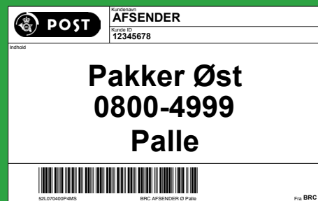
Denne mærkeseddel sættes på palle