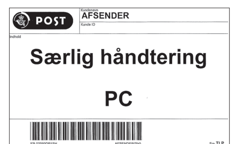
Denne mærkeseddel sættes på Postcontainer (PC)