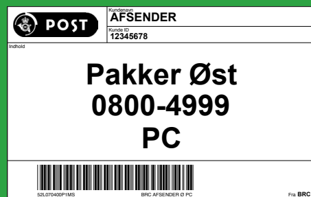
Denne mærkeseddel sættes på Postcontainer (PC)