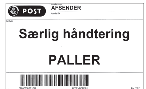
Denne mærkeseddel sættes på palle