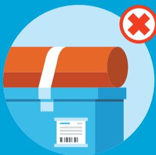
Uens pakker, bundet sammen

Her er eksempler på pakker, der ikke kan maskinsorteres og får tillagt gebyr, fordi de håndteres mere manuelt: