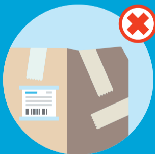
Dårligt emballerede pakker, der ellers ville kunne maskinsorteres.