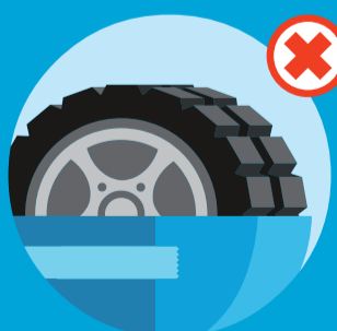
Dæk og fælge