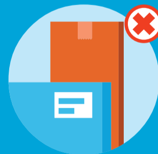
Pakker over 115 cm i længden og/eller over 60 x 60 cm.