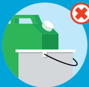
Dunke og spande