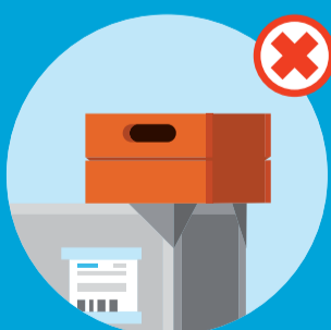
Metal-, plast- og trækasser