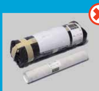
Ruller og rør