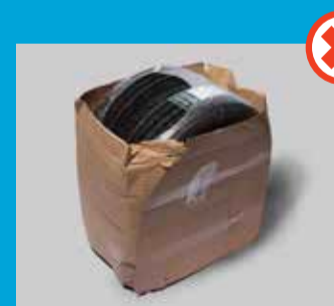
Dæk og fælge