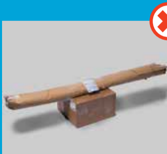
Uens pakker, bundet sammen