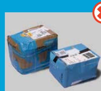
Dårligt emballerede pakker, der ellers vil kunne maskinsorteres

Er pakken længere end 175 cm, betales der i stedet for et oversizetillæg.