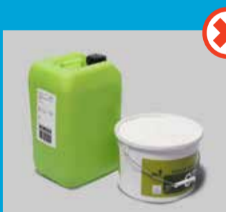
Dunke og spande

Her er eksempler på pakker, der ikke kan maskinsorteres og får tillagt gebyr, fordi de håndteres mere manuelt: