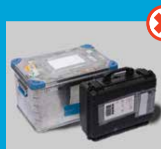
Metal-, plast- og trækasser