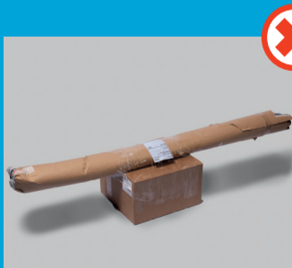
Uens pakker, bundet sammen