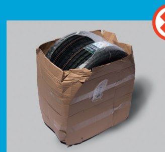
Dæk og fælge