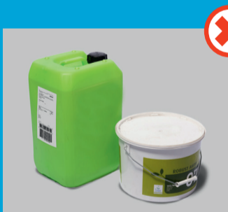
Dunke og spande

Her er eksempler på pakker, der ikke kan maskinsorteres og får tillagt gebyr, fordi de håndteres mere manuelt: