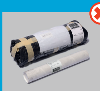
Ruller og rør