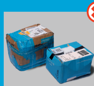
Dårligt emballerede pakker, der ellers vil kunne maskinsorteres