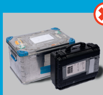
Metal-, plast- og trækasser